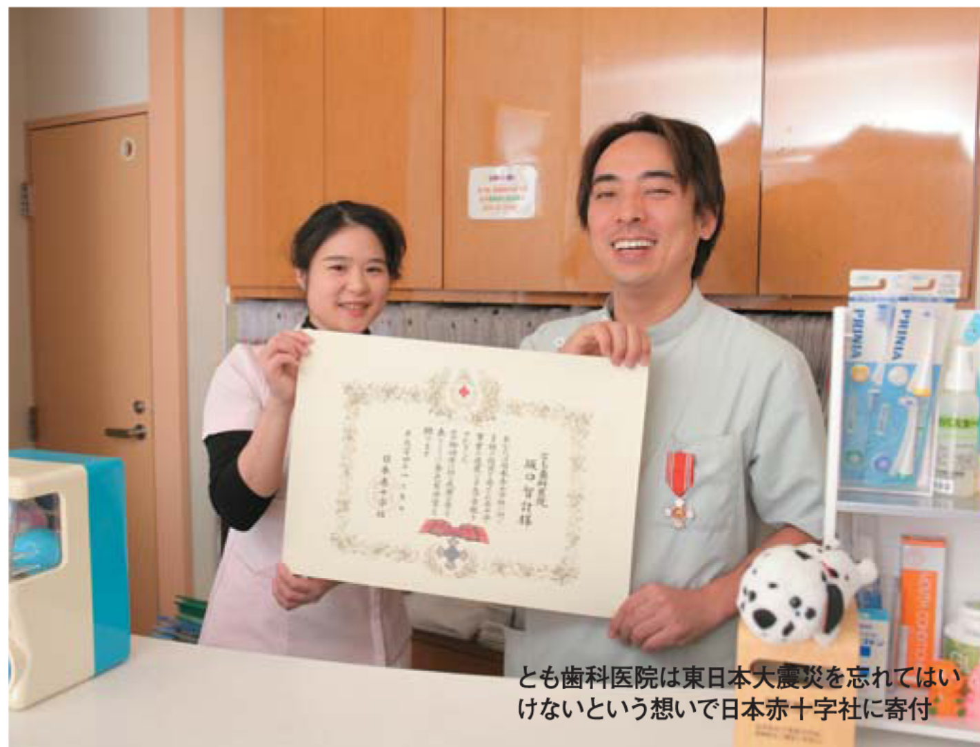
とも歯科医院は東日本大震災を忘れてはいけないという想いで日本赤十字社に寄付

治療に使用する器具のほか、ガス滅菌器を使用し、プラスチックにまで徹底的に滅菌を施し感染予防に努めます